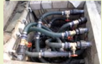
Pumpenschächte werden gern zu klein gebaut. Dieser ist 1 x 1 m groß, enthält 2 Pumpen und eine Verteilung auf mehrere Quellen.

Enthalten sind: Saug-Vorfilter, die Foliendurchführung sowie die Übergänge auf die Saugleitung. Zusätzlich wird benötigt: mind. 2 m Saugleitung (Dicke abhängig von der Länge und der Pumpe), 2 Schlauchschellen,