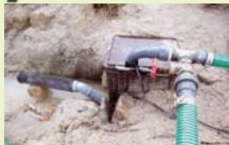
Am Ende des Filtergrabens steht der Pumpenschacht. In diesem Fall wird durch den gebogenen Druckstutzen das Wasser auf zwei Quellen/Filter verteilt.

des Teiches über der Folie. Diese Montagetechnik ist am einfachsten und wurde daher früher überwiegend praktiziert. Die Pumpe befindet sich dann allerdings direkt im Teichwasser. Bei 230 Volt-Betrieb verlangen die VDE-Regeln, daß Sie vorsichtshalber den Stecker ziehen, bevor Sie ins Wasser fassen. Sicherer ist der Einsatz einer 12Volt-Anlage. Die Mehrkosten für Trafo etc. lohnen sich, weil man dann keine Durchführung zu einem externen Pumpenschacht bauen muß.